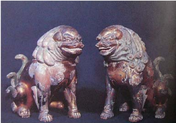
図説 廿日市の歴史より

木地の上にほご紙を貼り、その上に胡粉を塗って漆を重ね塗りし仕上げた、室町中期頃の作。